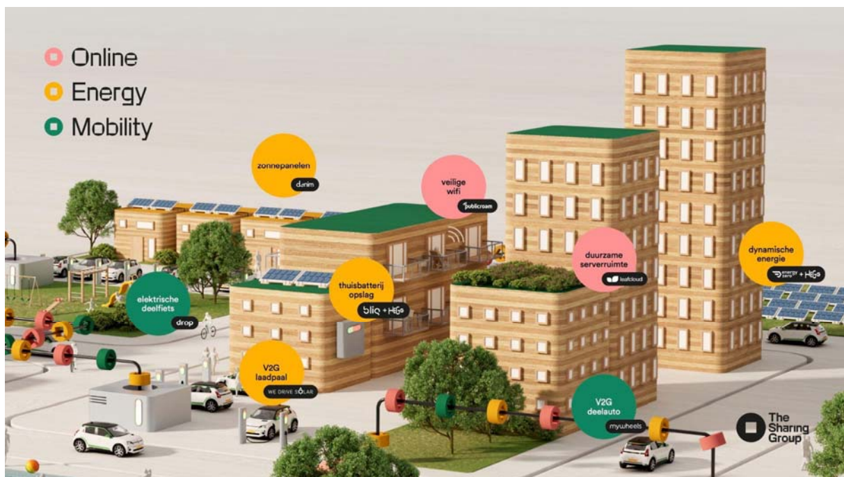
Figuur 1 - Visualisatie van de People's Power Plant in actie. De verschillende merken binnen de TSG Groep spelen direct of indirect een rol bij het realiseren van TSG's strategie.

De Uitgevende Instelling is actief in markten die gereed zijn voor structurele hervorming. Met een focus op de energie- en mobiliteitssector is haar strategie het ontwikkelen van de People's Power Plant in lijn met TSG's Good Sharing -filosofie, die winst en impact combineert. De People's Power Plant helpt het groeiende probleem van congestie op te lossen: in de openbare ruimte via gedeelde mobiliteitsoplossingen en op het elektriciteitsnet via gedeelde energieactiviteiten. De verschillende proposities binnen TSG worden gebundeld in het gezamenlijke aanbod: de People's Power Plant , dat duurzame waarde creëert voor steden/regio's, bedrijven en individuele huishoudens.